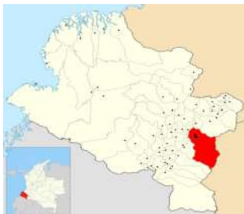
Figura 1. Ubicación del Municipio de Pasto en el Departamento de Nariño. Adaptado de “Plan de Desarrollo del Departamento de Nariño 2016-2019”. Gobernación Departamento de Nariño.

El Municipio de Pasto se ubica en la parte suroriental del Departamento de Nariño, perteneciente, este último, al territorio suroccidental de Colombia en la zona fronteriza con la República de Ecuador, entre el litoral pacífico y la vertiente oriental Amazónica. Tiene una extensión territorial de 33.268 km 2 , y constituye el 2.9% de la extensión total del país. Hace parte del Chocó biográfico, macro-región rica en biodiversidad y en especies endémicas; junto con el Departamento del Cauca, constituye la territorialidad característica de las sociedades andinas (véase figura 1).