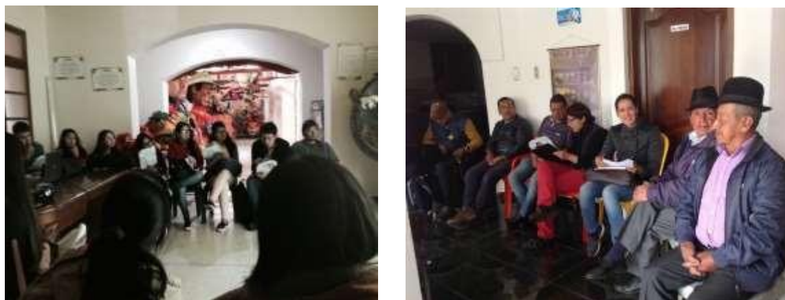
Figura 9. Participantes del censo de artistas y artesanos