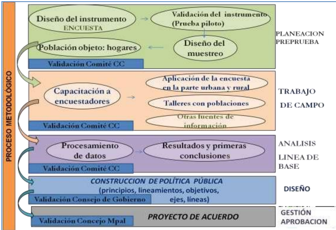
Figura 4. Proceso metodológico