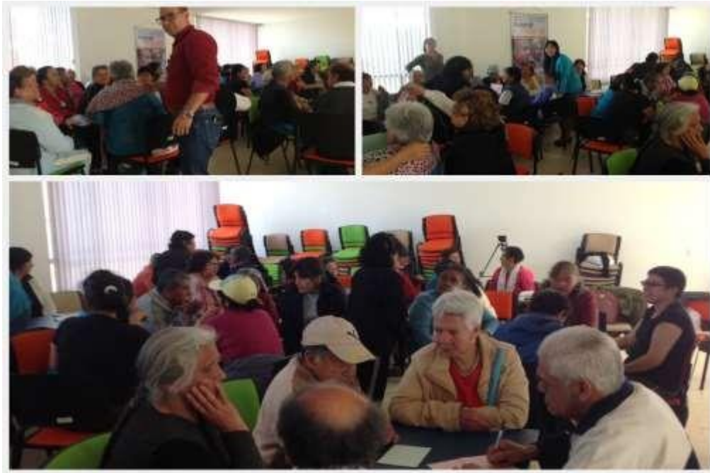
Figura 10. Taller con población de adultos mayores