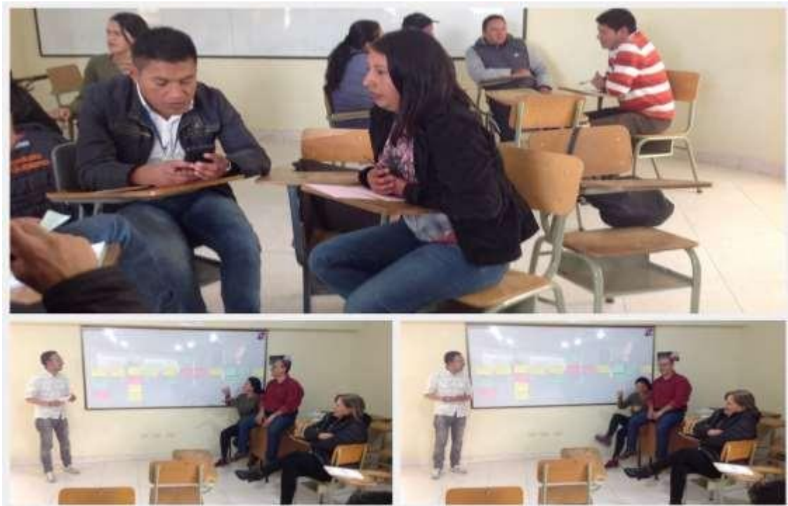
Figura 7. Taller con corregidores del Municipio de Pasto