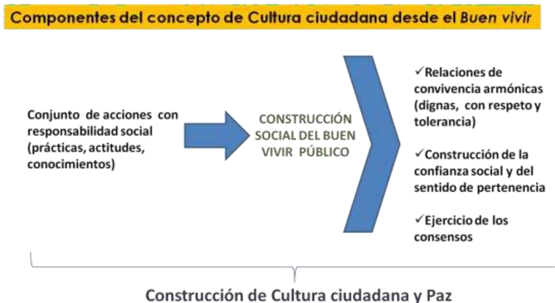
Figura 3. Componentes del concepto de cultura ciudadana desde el Buen vivir

El concepto de Cultura ciudadana bajo la concepción del Buen vivir que asume esta política pública, se sistematiza de la siguiente manera: