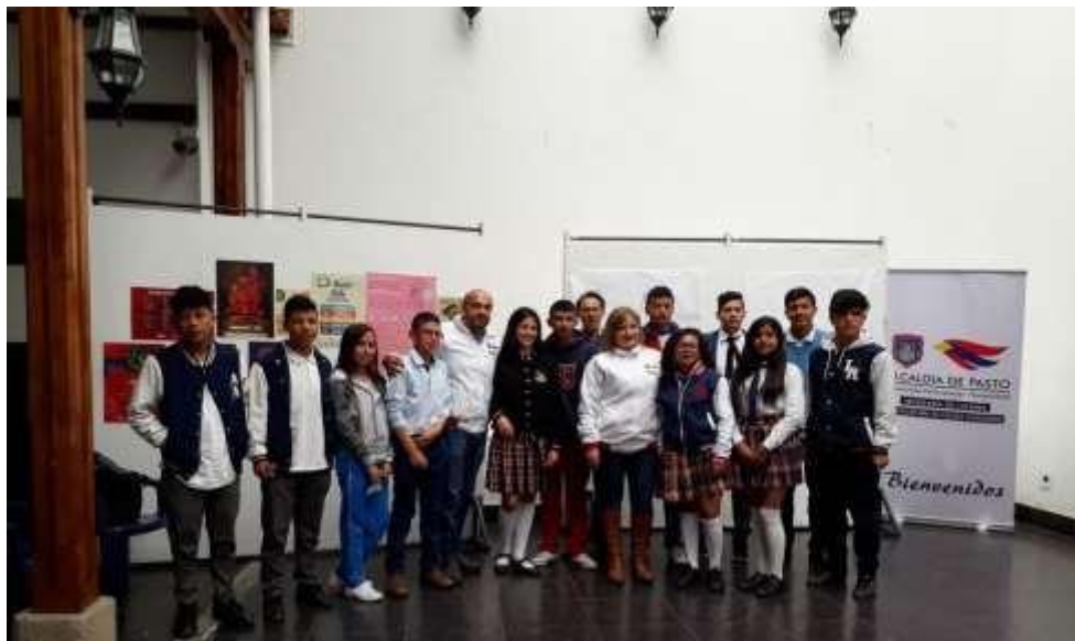
Figura 5. Taller con personeros de Instituciones educativas del Municipio de Pasto