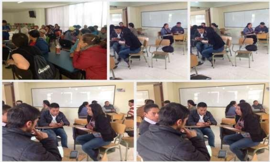
Figura 6. Taller con líderes comunitarios y corregidores del Municipio de Pasto