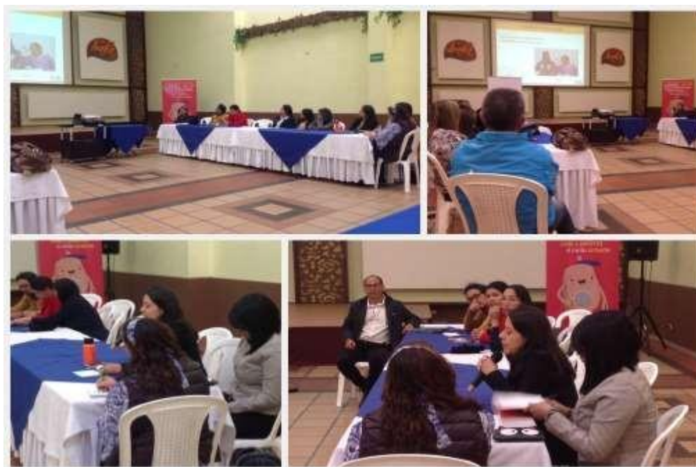
Figura 8. Taller con el Comité de Cultura Ciudadana