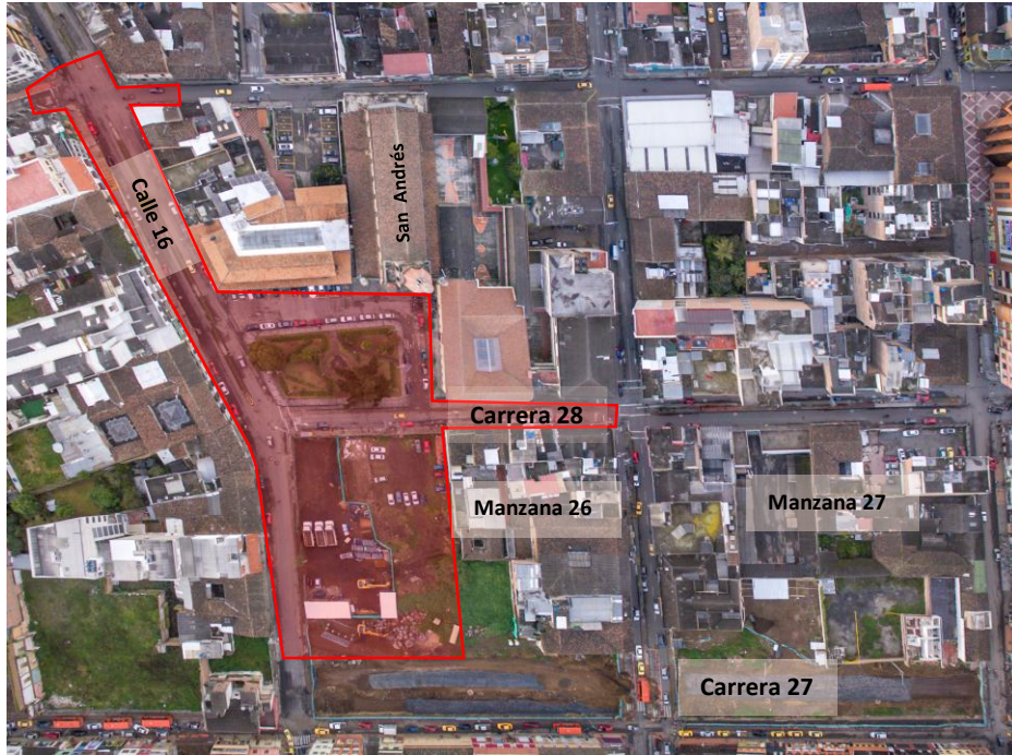
Imagen cenital del sector del concurso en el CH de Pasto. Fotografía 22-01-2018