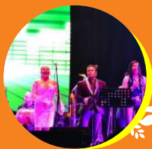
Orquesta Pasto All Star Hora: 7:00 p.m.