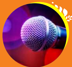
Artista invitado Hora: 9:00 p.m.