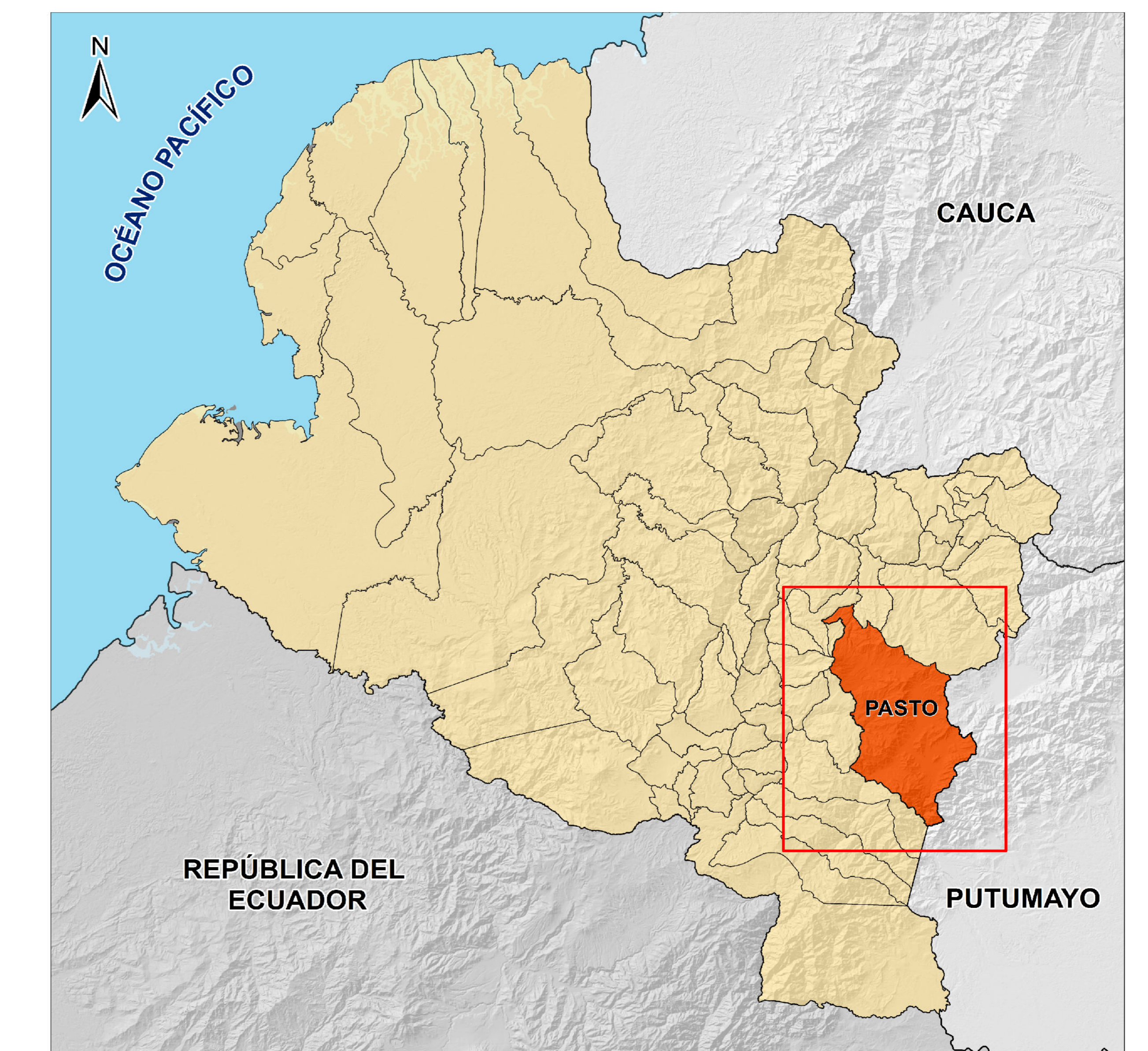
MUNICIPIO DE PASTO