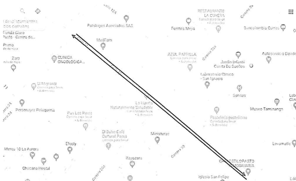
IMAGEN SENTIDO VEHICULAR ACTUAL

ARTÍCULO SEGUNDO. - Modificar el sentido de circulación vehicular bidireccional a unidireccional occidente - oriente, de la calle 12 entre carreras 27 y 34 de la Ciudad de San Juan de Pasto, cómo se detalla a continuación: