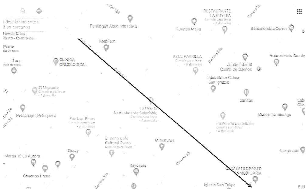
IMAGEN SENTIDO VEHICULAR PROYECTADO

PARÁGRAFO. - Los cambios de sentidos vehiculares de que trata el presente acto, rigen a partir del día veintidós (22) de febrero de dos mil veintiuno (2021).