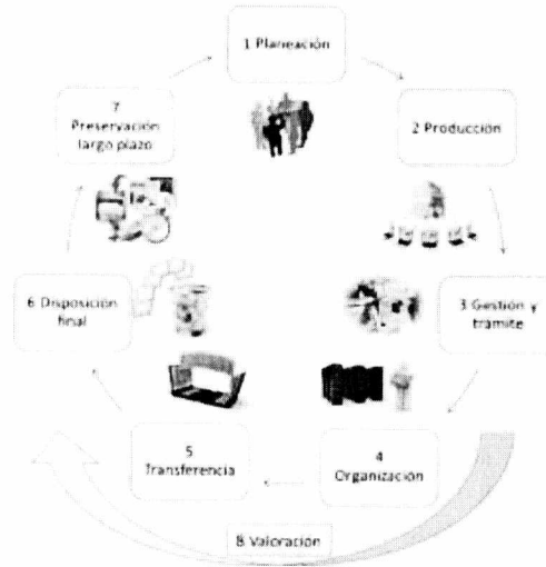
Figura 1-procesos archivísticos