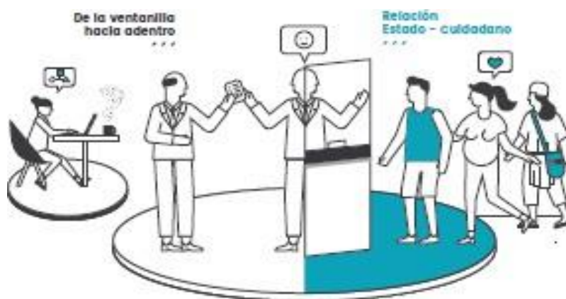
Gráfica 5 Dimensión Gestión con Valores para el Resultado