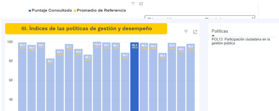
Gráfica 8 Resultados Dimensión de Gestión para Resultados y Política de Participación Ciudadana 2023