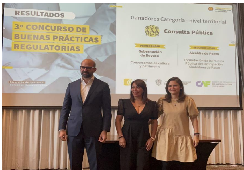
Imagen 35: Segundo lugar - Consulta Pública y Participación - Formulación de la Política Pública de Participación Ciudadana de Pasto.