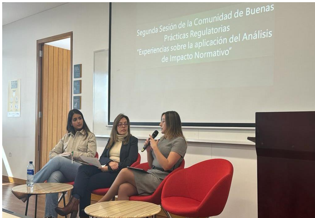
Imagen 37: Primera Sesión de la Comunidad de Buenas Prácticas Regulatorias.