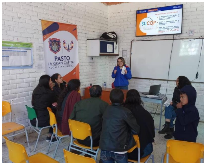
Socialización con la comunidad sobre el uso de la plataforma SUCOP

Durante el segundo semestre de 2022, la Feria de Gestión fue realizada en el corregimiento de Obonuco y, en esa oportunidad, la Oficina de Asesoría Jurídica del Despacho realiza difusión y pedagogía sobre las políticas que implementa, así como los buenos resultados obtenidos en el marco del Concurso de buenas prácticas regulatorias organizado por DNP y CAF.