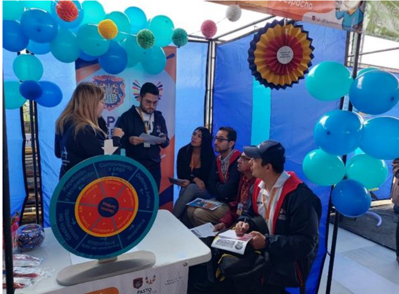
Imagen 15: Socialización políticas de defensa jurídica y mejora normativa en la “Semana de la Calidad”.