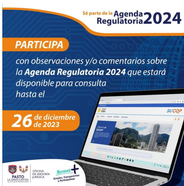
Imagen 27: Difusión en redes sociales agenda regulatoria 2024 – Alcaldía de Pasto.