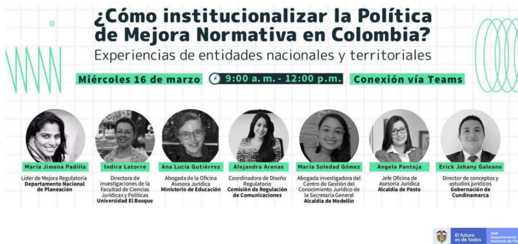
Imagen 9: ¿Cómo institucionalizar la Política de Mejora Normativa?