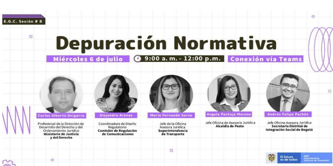
Imagen 11: Depuración Normativa.