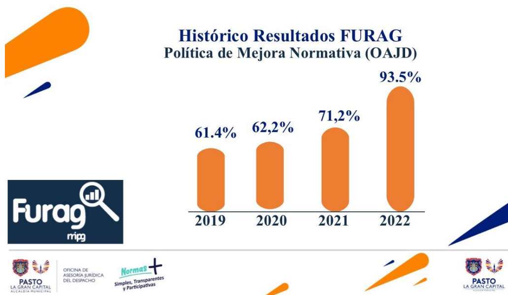
Imagen 3: Histórico Resultados FURAG 2019 - 2022

Fuente: Resultados de medición MIPG – Función Pública https://www.funcionpublica.gov.co/web/mipg/resultados-medición