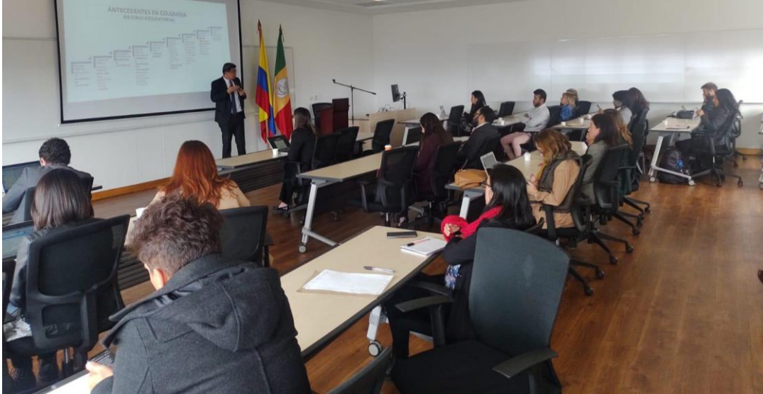
Imagen 36: Primera Sesión de la Comunidad de Buenas Prácticas Regulatorias.