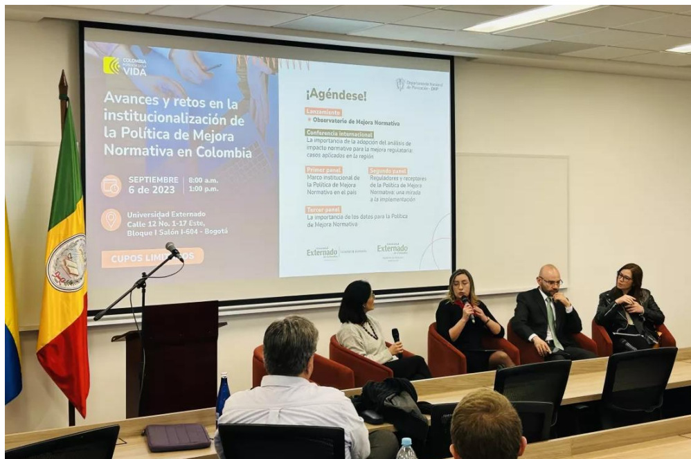
Imagen 19: Participación en el foro “Avances y retos en la institucionalización de la Política Mejora Normativa en Colombia”.