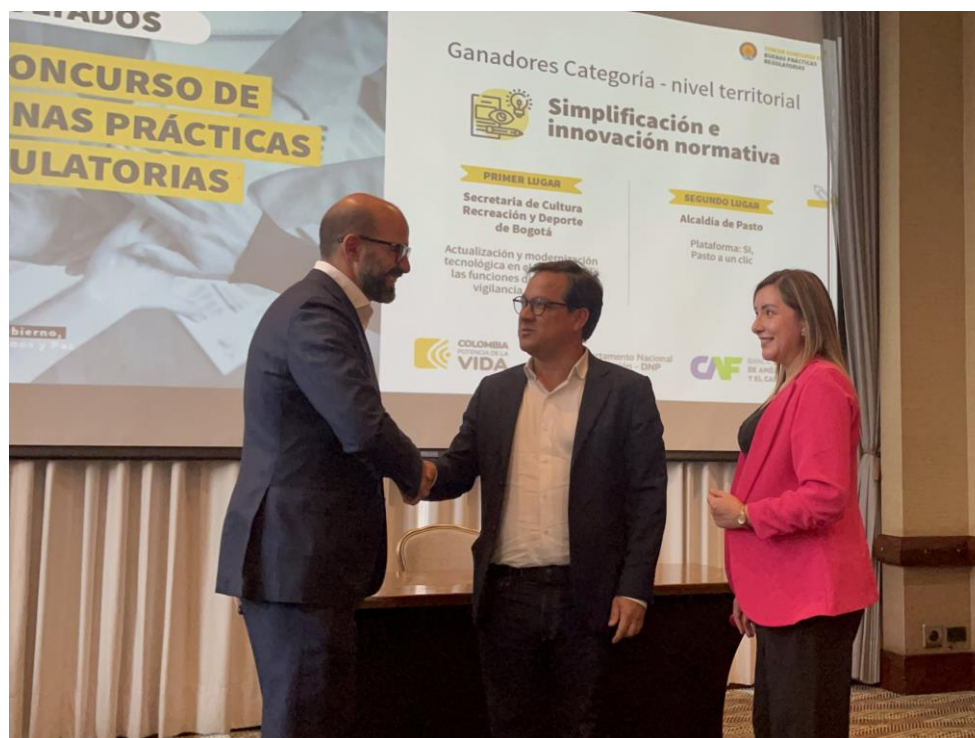
Imagen 34: Segundo puesto - Simplificación e Innovación Regulatoria - Plataforma: "SI, Pasto a un clic".