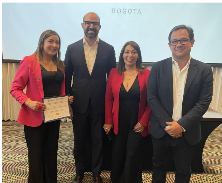
Imagen 33: Primer lugar - Inventario y Depuración Normativa - Construcción de Inventario Normativo y avance ejercicio de Depuración Normativa de la Alcaldía de Pasto

Fuente: Departamento Nacional de Planeación.