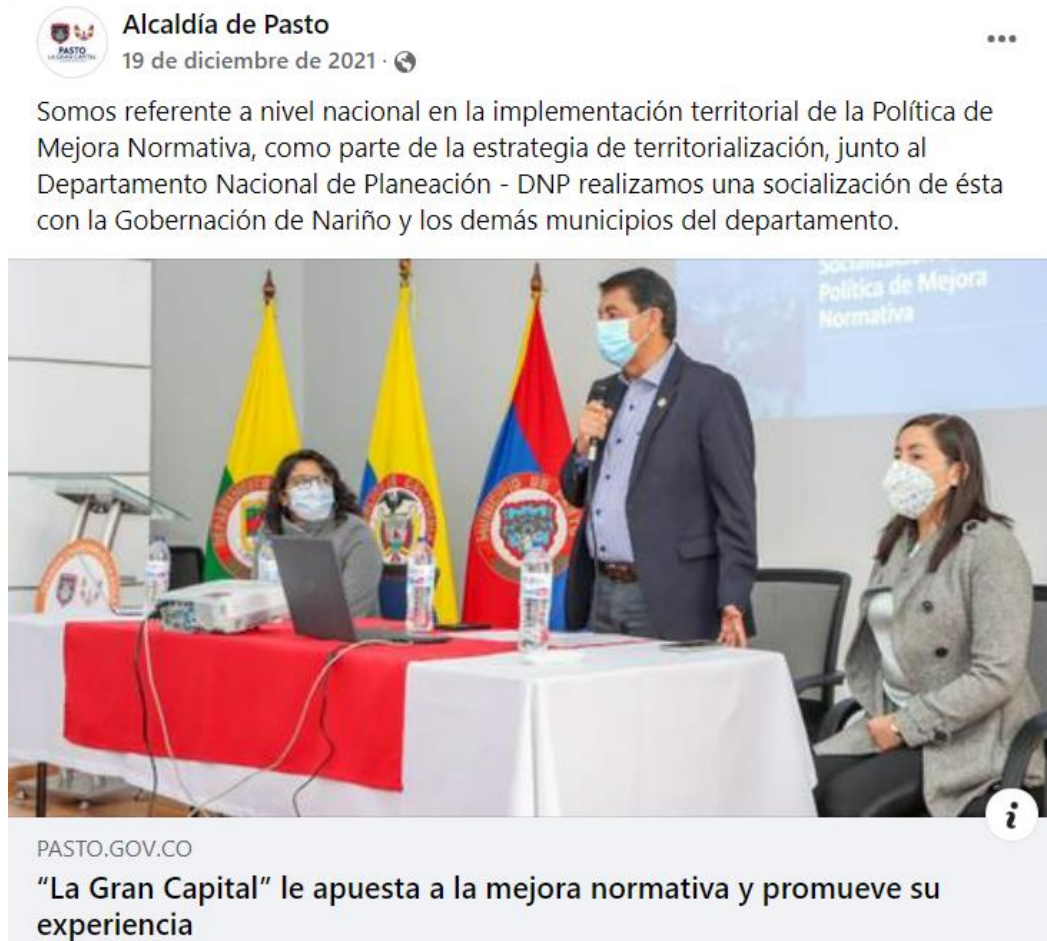
Imagen 5: Socialización de la Política Mejora Normativa a entidades territoriales del departamento de Nariño.