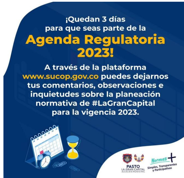
Imagen 26: Difusión en redes sociales agenda regulatoria 2023 – Alcaldía de Pasto.