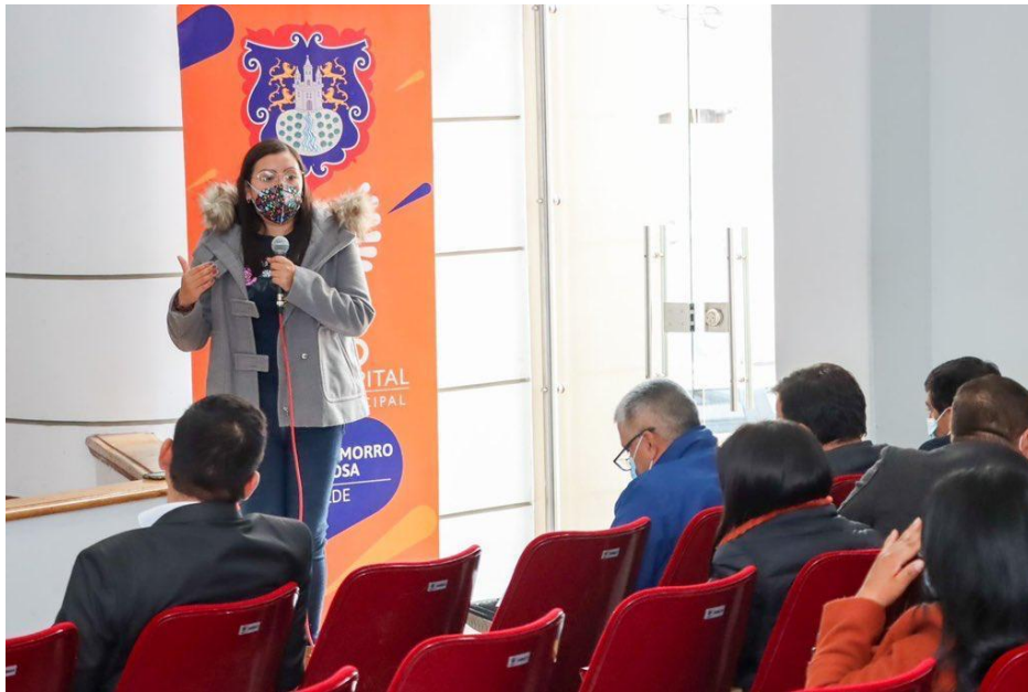
Imagen 21: Visitas del territorio - Fortalecimiento de la entidad 2022.