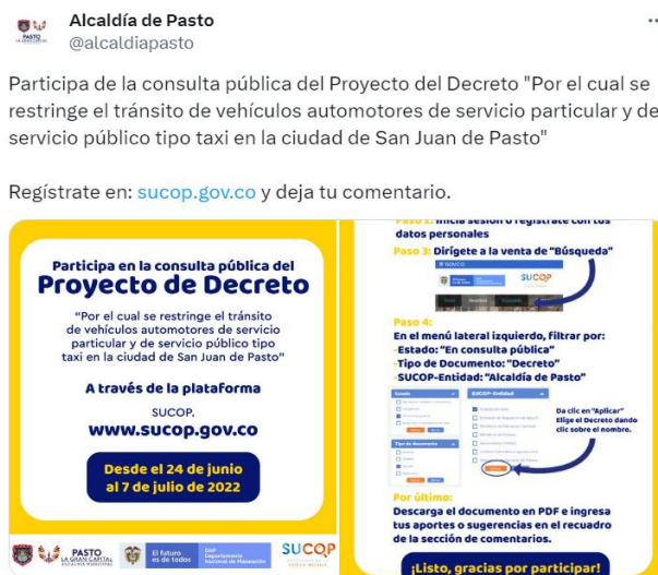
Imagen 24: Difusión mediante redes sociales de la agenda regulatoria 2022 – Alcaldía de Pasto.