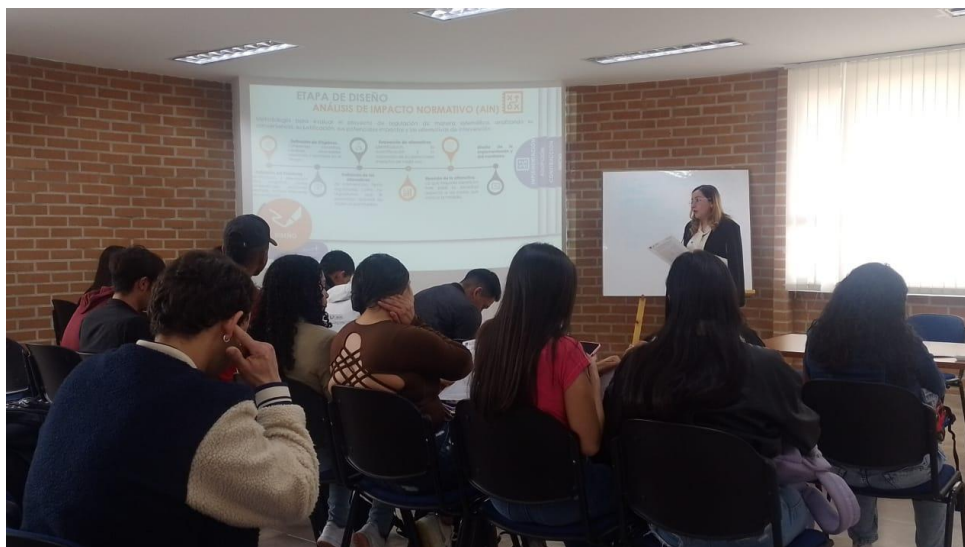
Imagen 20: Clase magistral “Política de Mejora Normativa en el Municipio de Pasto” - 16 de mayo 2023

Aludida clase magistral tuvo lugar el 16 de marzo de 2023, con la asistencia de cincuenta y siete estudiantes de diferentes semestres, quienes recibieron capacitación sobre componentes de la Política de Mejora Normativa, el Ciclo de gobernanza regulatoria, herramientas de racionalización, depuración, evaluación y simplificación y, finalmente, el marco normativo que respalda el proceso.