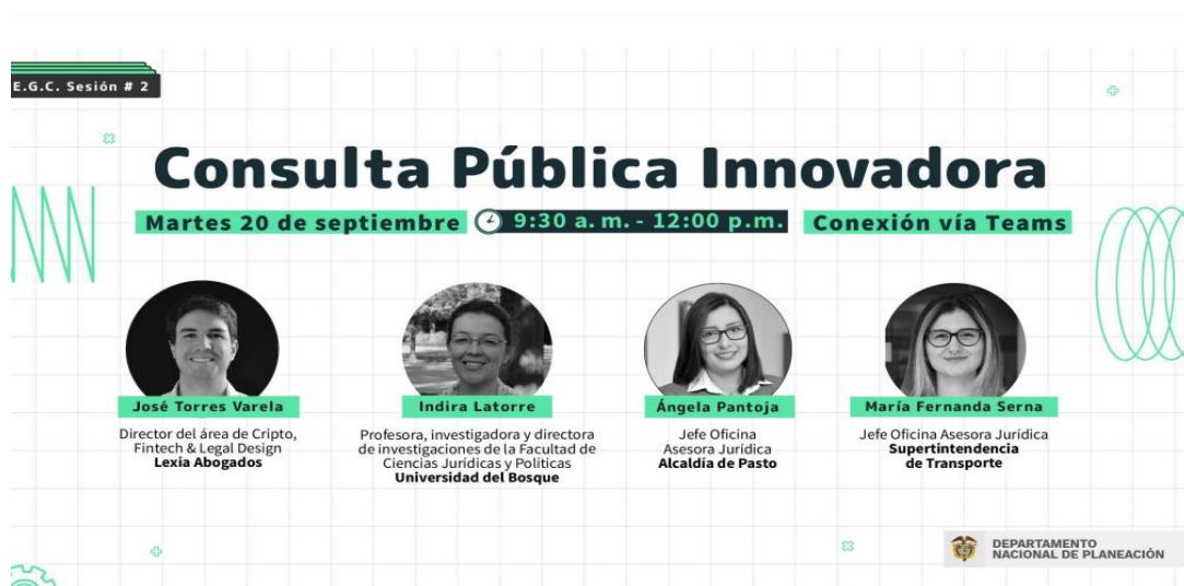
Imagen 13: Consulta pública innovadora