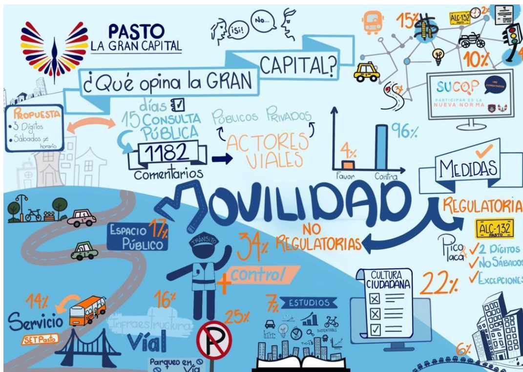
Imagen 25: Herramienta de Visual Learning empleada para analizar y socializar los resultados de la consulta pública.