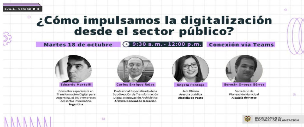
Imagen 14: ¿Cómo impulsamos la digitalización desde el sector público?