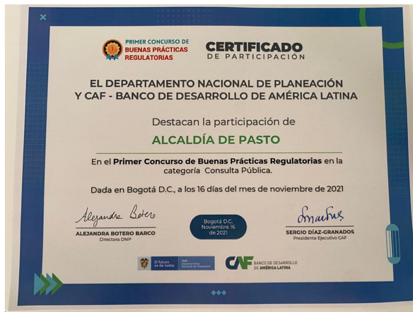
Imagen 31: Reconocimiento por iniciativa “agenda regulatoria 2021”.