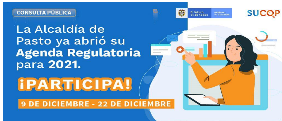
Imagen 2: Difusión agenda regulatoria 2021 mediante redes sociales.