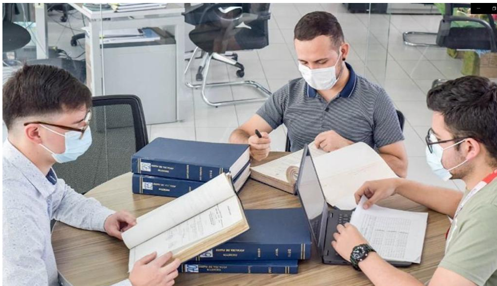
Imagen 28: Ejercicio de depuración normativa - 1