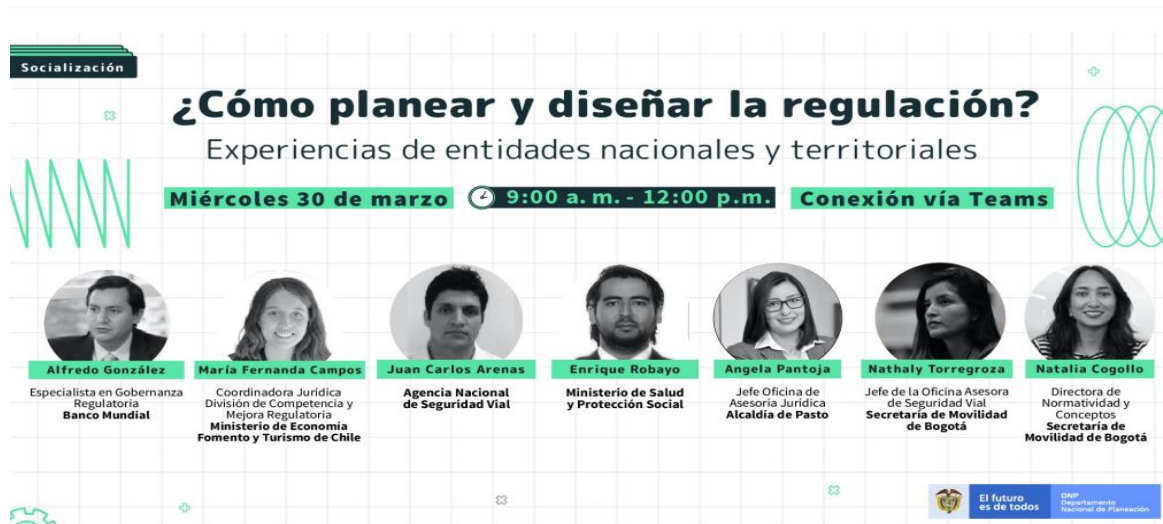
Imagen 10: ¿Cómo planear y diseñar la regulación?