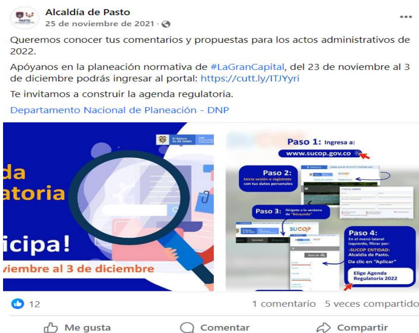
Imagen 4: Difusión agenda regulatoria 2022 – Alcaldía de Pasto